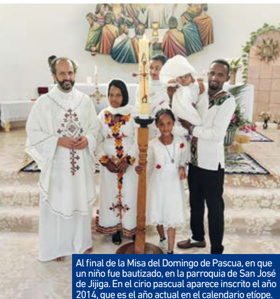
Al final de la Misa del Domingo de Pascua, en que un niño fue bautizado, en la parroquia de San José de Jijiga. En el cirio pascual aparece inscrito el año 2014, que es el año actual en el calendario etíope.

Y tampoco debemos pensar que aquí todo sean limitaciones, ni que todo sea mejor allí. A medida que nos vamos despojando de toda una serie de lujos y prisas que el consumismo de nuestra sociedad nos