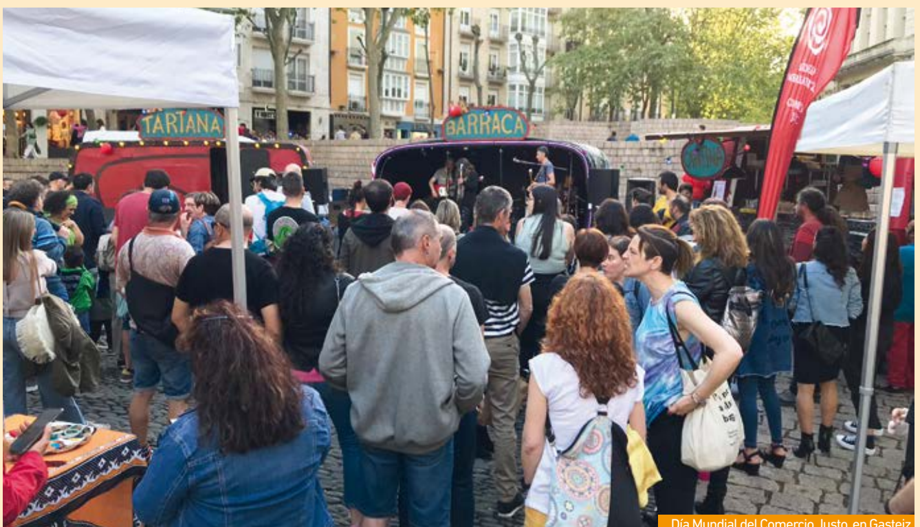
Día Mundial del Comercio Justo, en Gasteiz

Ni el viento, ni los truenos, ni la lluvia que barrió la ciudad por la tarde pudo con nosotras y es que había muchas ganas de celebrar y compartir, después de 2 años de pandemia. Resistimos y tras la tormenta, vino la calma y el sol y acabamos el día con un concierto