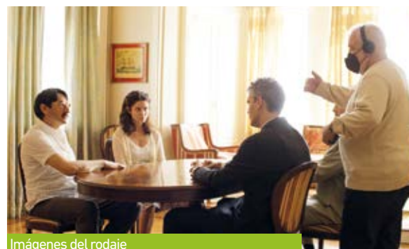
Imágenes del rodaje

Fue hace unos 4 años “cuando estuvimos preparando el guion, viviendo en la UCA, nos aconsejaron quedarnos allí y fue un consejo maravilloso, en lugar de ir a un hotel, estuvimos compartiendo con personas de distintos lugares del mundo que van allí a dar clases. Fue una experiencia estupenda. La gente sigue recordando este hecho, estuvimos hablando con Tojeira y con varios jesuitas”.