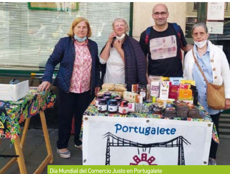
Día Mundial del Comercio Justo en Portugalete

Otro de los retos en estos dos últimos años ha sido trabajar en el proceso organizacional de pro equidad de género. Tras hacer un diagnóstico han elaborado un plan estratégico que se unirá a su hacer y que aportará la mirada de la igualdad de género en su tarea, para seguir trabajando en la construcción de un mundo más justo, igualitario y fraterno para todas las personas.