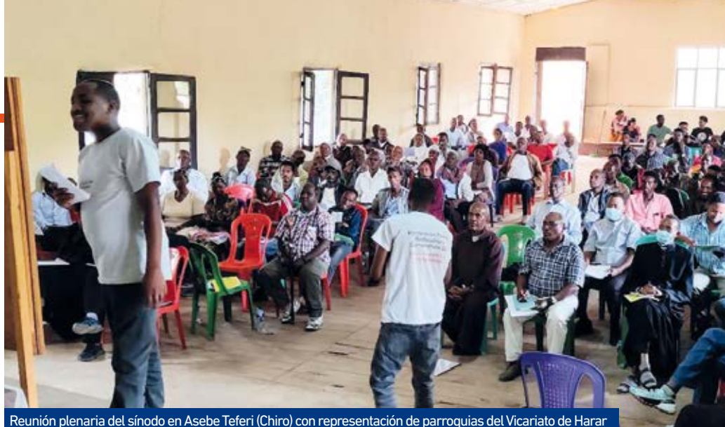
Reunión plenaria del sínodo en Asebe Teferi (Chiro) con representación de parroquias del Vicariato de Harar

En Jijiga existe una mayoría musulmana de etnia y lengua somalí, y una nutrida minoría de otras et-