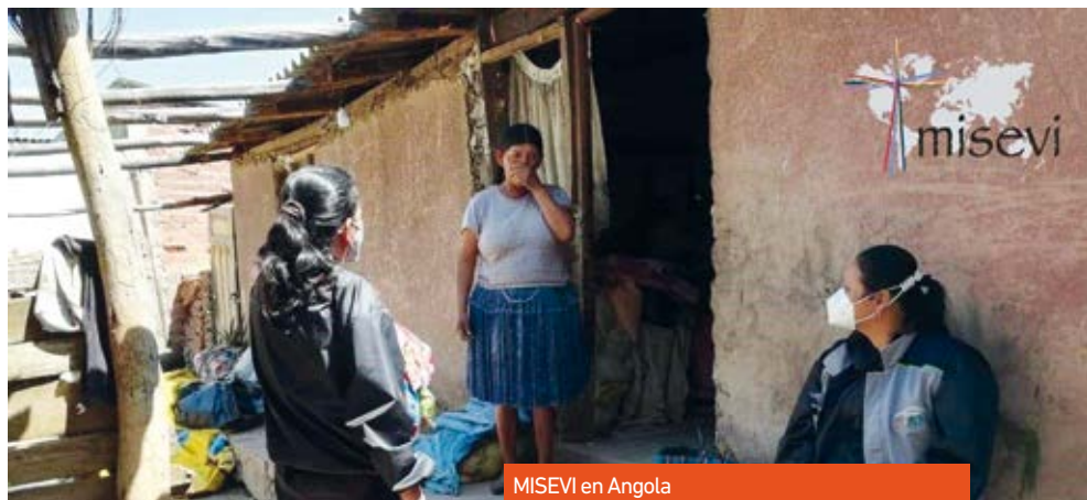
MISEVI en Angola

Entendemos que, en este momento, nuestra misión es trabajar desde la metodología del cambio sistémico, favoreciendo la promo-