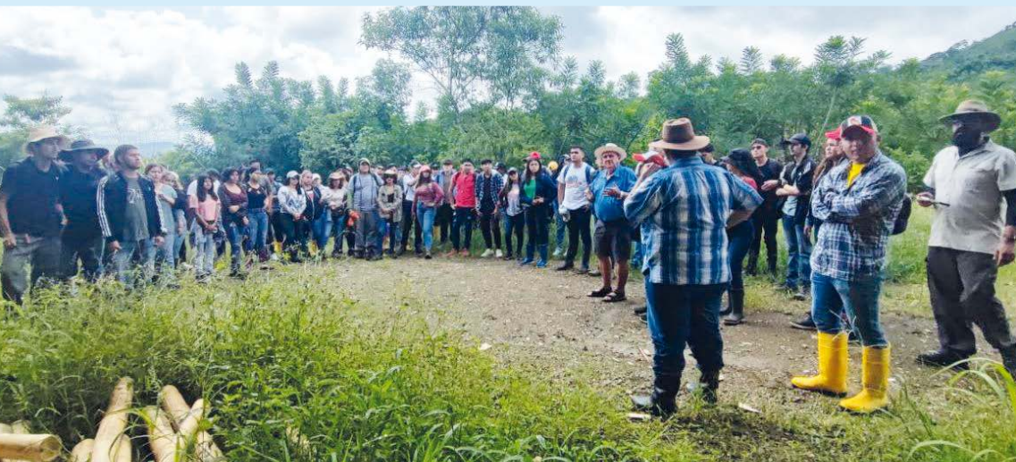
80 jóvenes estudiantes de agronomía de la ULEAM (Universidad Laica Eloy Alfaro, de Manta) visitan, con sus docentes, la finca de la Fundación, para conocer el proyecto Raíces y Sueños.

Estamos comenzando un curso de capacitación de guías locales de turismo.