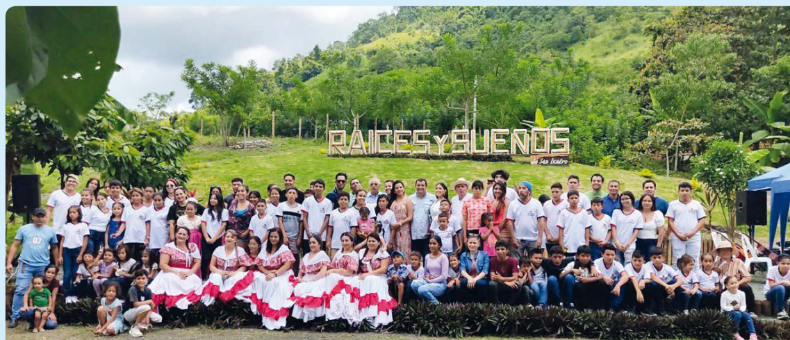
Convivencia artística invernal de los jóvenes artistas de Raíces y Sueños de San Isidro con el prefecto provincial y las autoridades de la mancomunidad norte Sucre, San Viente, Jama y Pedernales.

Esta fragilidad que vive el país nos afecta a todos y,