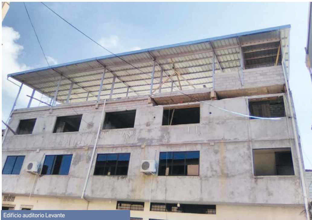
Edificio auditorio Levante

En 2023, la diócesis de Babahoyo renueva por 25 años el comodato del terreno al Centro Comunal. Así, el CIPEM ofrece parte de sus instalaciones para la creación de la tan ansiada Casa de Acogida de Los Ríos, destinada a mujeres, niñas, niños y adolescentes que deben abandonar urgentemente su hogar y rehacer su vida.