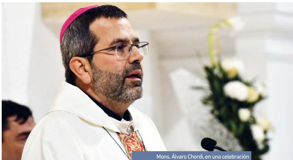
Mons. Álvaro Chordi, en una celebración

La Iglesia de Chile ha sido reprobada -suspendida- en humanidad y señalada públicamente como una