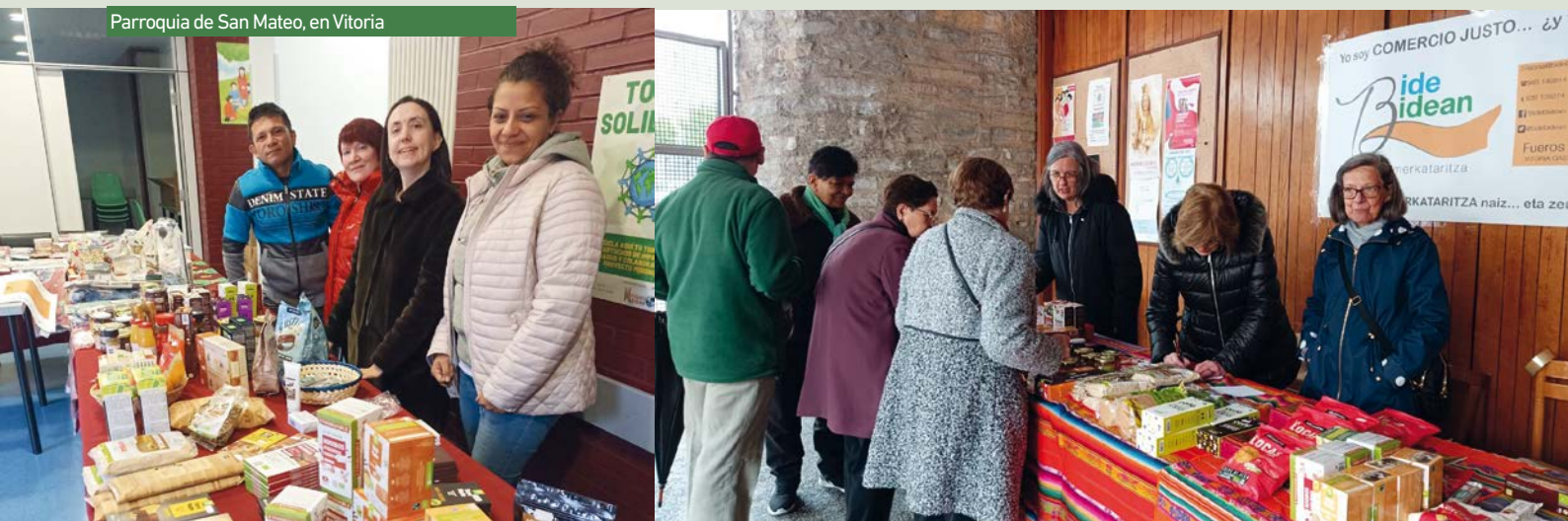
Parroquia de San Mateo, en Vitoria

Bidezko merkataritzak ekoizleen lan eta giza eskubideak bermatzen ditu eta ingurumena errespetatzen du.