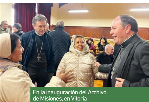
En la inauguración del Archivo de Misiones, en Vitoria

Las Voces del Sur han animado la sensibilización de la campaña con su presencia en el colegio diocesano de Larramendi, así como en parro-