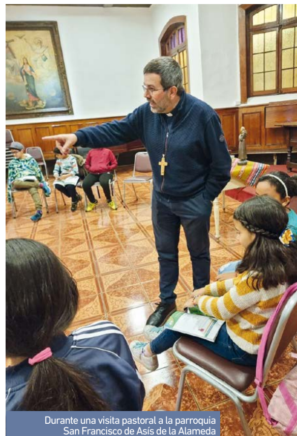
Durante una visita pastoral a la parroquia San Francisco de Asís de la Alameda

Estamos desafiados a ser una Iglesia que desea ver en sus miembros la responsabilidad de seres adultos , más que una obediencia infantil, y que desea ayudar a todos a crecer y a ser lo que son capaces